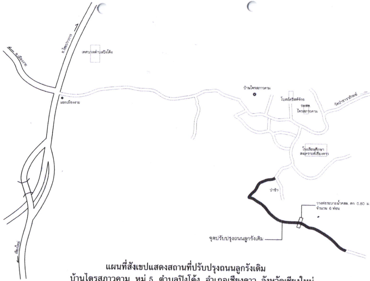
แผนที่สังเขปแสดงสถานที่ปรับปรุงถนนลูกรังเดิม บ้านไตรสภาวคาม หมู่ 5 ตำบลปึงโค้ง อำเภอเชียงดาว จังหวัดเชียงใหม่